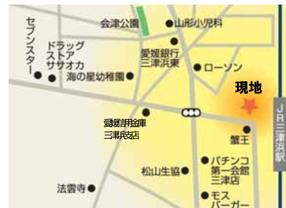
< 現地 MAP >

JR 三津浜駅前におきまして、4 月より分譲開始の『グランディア会津』。これまでに三津浜エリアを中心として、興居島、中島へも営業スタッフがご挨拶に参らせて頂いておりますが、大変多くの方から『立地が最高ですね』と利便環境の魅力について感想をお聞かせ頂いております。