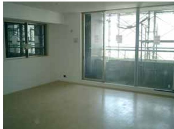
工事現況(Cタイプ 403号室, LD)

本年 11 月末の完成に向けまして、順調に工事が進められている『グランディアステーションタワー』。JR 松山駅や伊予鉄大手町駅の改札を出ますと、すぐにその工事の様子が窺えます。7 月下旬の段階におきまして、躯体工事は 13 階部分までのコンクリート打設、仕上工事では 7 階で床のフローリング貼り、9 階で壁・天井のボード貼り、11 階でサッシ取り付け等が行われております状況です。