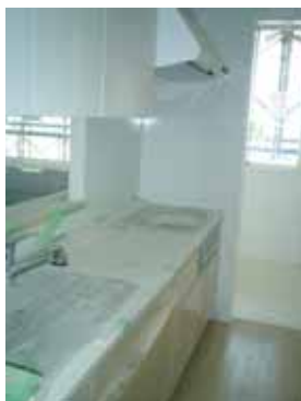
工事現況(Cタイプ403号室 左:玄関 右:キッチン)