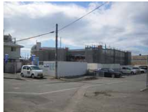
工事現況 H19.7.15 撮影