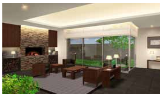
エントランスラウンジ イメージパース