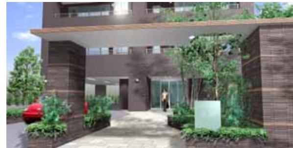
エントランスアプローチ イメージパース